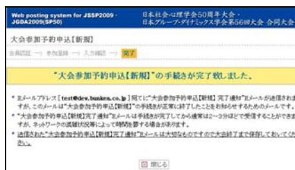
【参加申込完了画面】

右の画面が表示されれば、参加申込完了です。 参加申込完了通知メールが、申込時のメールアドレスに送信されますので、 必ず、確認 してください。