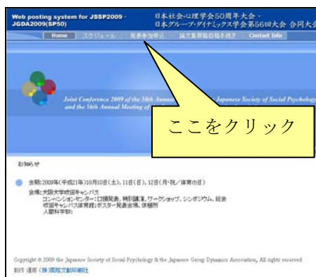
【合同大会 Web ページ】

※ 参加申込時点で、「研究発表」に入力をし忘れた方は、参加申込の「申込内容の修正・変更」から登録内容の修正・変更を行ってください。