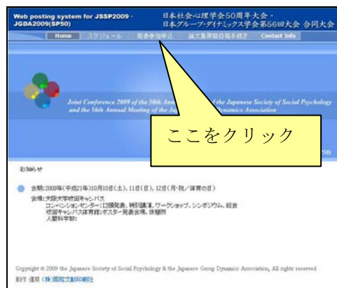
【合同大会 Web ページ】

合同大会 Web ページにアクセスして、「発表参加申込」をクリックしてください。続いて、エントリーページの「参加申込」ボタンを押してください。