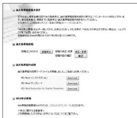
【エントリーページ】