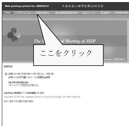
【大会 Web ページ】

第53回大会 Web ページにアクセスして、「発表参加申込」をクリックしてください。続いて、エントリーページの「参加申込」ボタンを押してください。