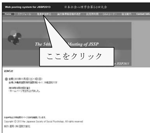
【大会 Web ページ】

第54回大会 Web ページにアクセスして、「発表参加申込」をクリックしてください。続いて、エントリーページの「参加申込」ボタンを押してください。